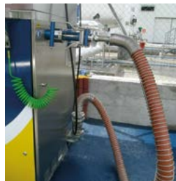
Manguera y conector entrada líquido