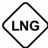
Gas natural licuado