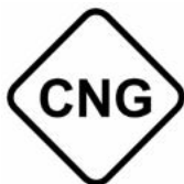
Gas natural comprimido

Nuestras estaciones de repostaje disponen del etiquetado identificativo de los combustibles , colocado en los surtidores y en las mangueras de repostaje, de acuerdo a lo establecido en la normativa europea.