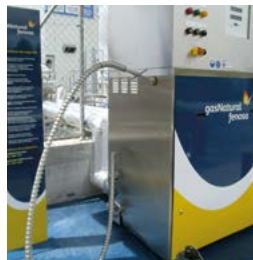
Conector retorno gas

En EESS para vehículos con presión de trabajo inferior a 15 bares.